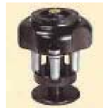
S52ST 形スイングロータ

本資料に関するお問い合わせは日立工機(株)ライフサイエンス機器事業部のホームページ ( https://ccs.hitachi-koki.co.jp/cgi-bin/himac/contactus/toiawase.cgi ) からお願いいたします。