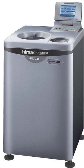
CS-150GX II 形小形超遠心機