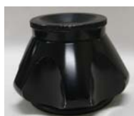
S100AT6 形アングルロータ