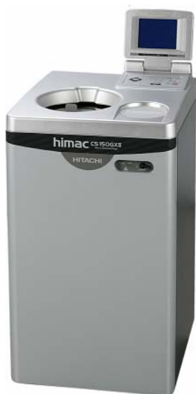
CS150GX II 形小形超遠心機