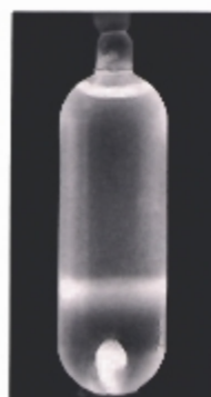
Fig.1 CsCl量：サンプル量 1.5：1